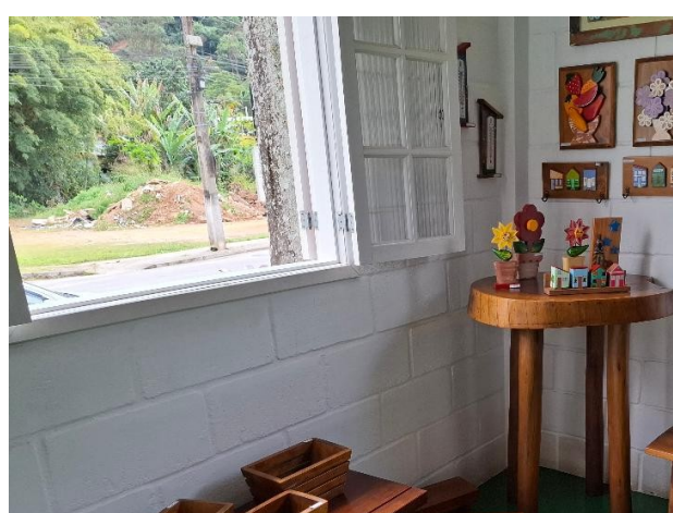
Tous ces meubles sont également fabriqués par nos jeunes et sont mis en vente à la maison des artisans