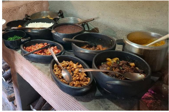
repas typique « fogo à lenha »