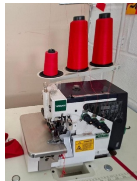
Nos trois nouvelles machines de la Maison MARTEC de Nova Friburgo, coût RS 15'300.00

Notre salle de couture est maintenant parfaitement équipée de six machines neuves, d'étagères de rangement, de mobilier adéquat ce qui nous permet de travailler dans des conditions optimales et professionnelles.