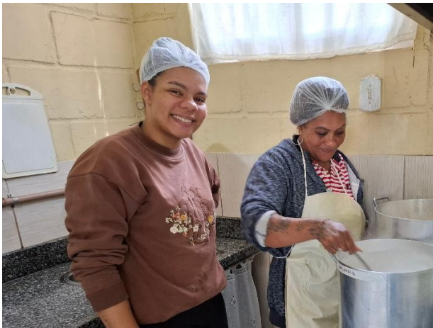
Préparation de notre fameuse soupe de chalet par nos deux cuisinières

Dès 17h00, nous nous sommes rendus au bâtiment de notre menuiserie-école, lieu de la commémoration de notre fête nationale suisse animée d'une part par le chœur de notre menuiserie-école et par le groupe de danse SWISSANDO venu spécialement de Nova Friburgo. Les images disent plus que des mots, alors voilà une panoplie de cette magnifique soirée qui s'est terminée par une soupe de chalet (excellente) offerte aux quelques 150 à 200 personnes présentes.