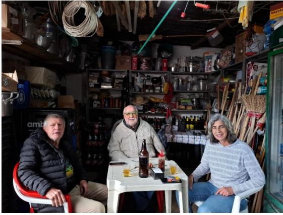
Apéro chez Coelhoinho (dans sa caverne d'Ali Baba)