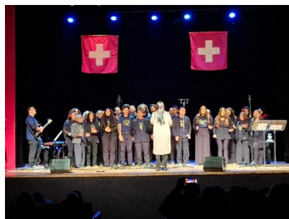
Les chœurs « Allons Chanter Juvenil » « Allons Chanter adultes » et le chœur de l'UENF de Campos