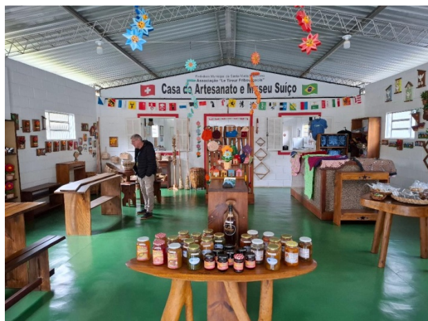
Tous ces objets (sauf les confitures) sont réalisés par nos jeunes de la menuiserie