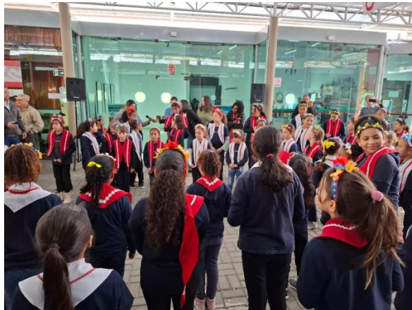
Le matin à la Place de la Colonisation